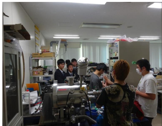
精密加工研究室見学