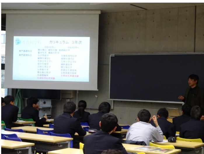
化学生物系学科説明