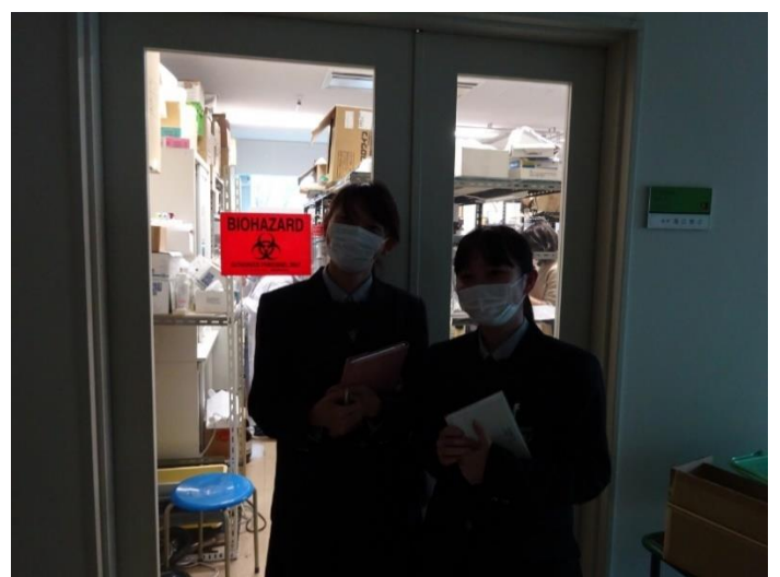
化学生物系研究室見学