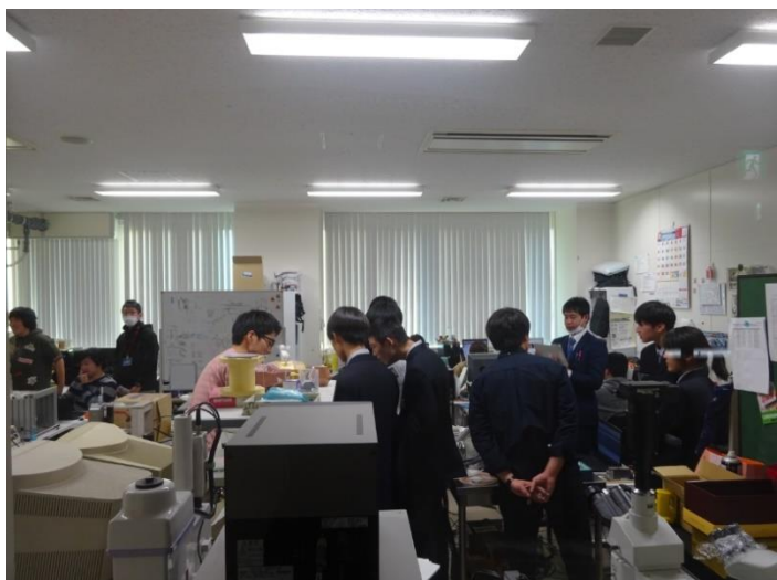
精密加工研究室見学