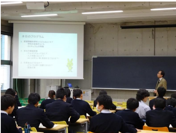
経営情報科学科の説明・模擬授業