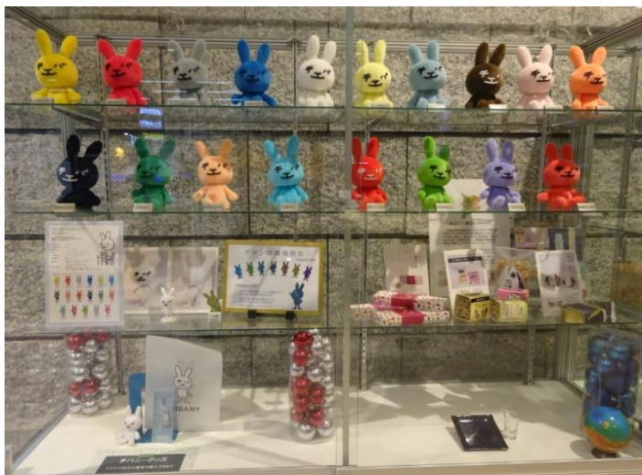
デザインに関する個別相談を行った生徒が見学した作品