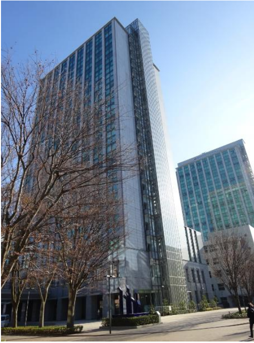
千葉工業大学 津田沼キャンパス

【千葉工業大学大学見学会】参加生徒83名 社会系模擬授業、工学・化学・生物系の研究室見学を行いました。