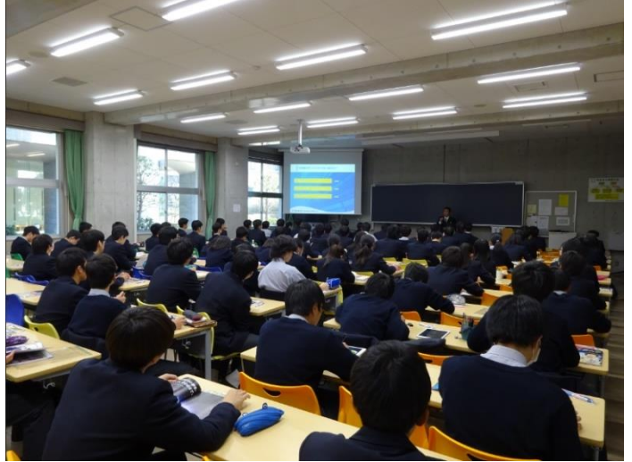
612教室 大学概要説明